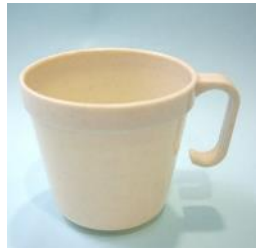
PP製240ml コーヒーカップ