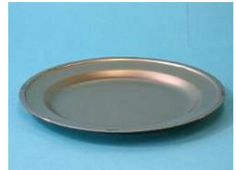
アルマイト製 18cm 平皿