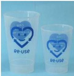
PP製 450ml 中カップ PP製 280ml 小カップ