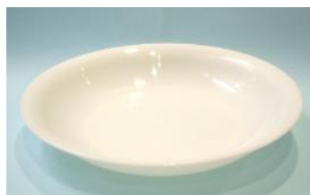
PP製 22×3.3 cm L皿