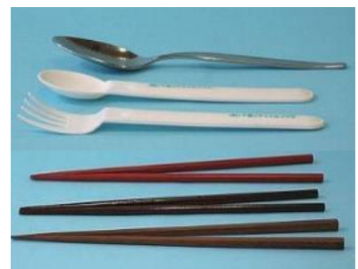
塗り箸、スプーン、フォーク