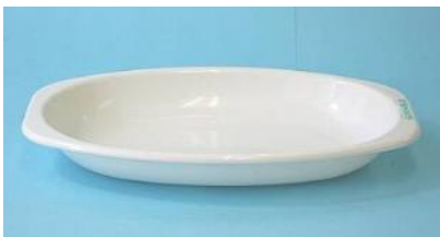
PP製 25×17.5cm カレー皿